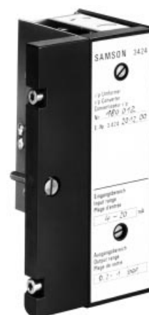
Rys. 2 · Samodzielny przetwornik i/p typu 424-11 z płytką do podłączenia wyjść

Oferujemy także wykonanie z przetwornikiem i/p wielkości regulowanej x i/lub przetwornikiem i/p zewnętrznej wartości zadanej w_{ext} . Szczegółowe informacje podajemy na życzenie.